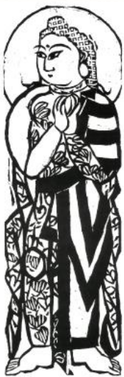
棟方志功《二菩薩釈迦十大弟子より文殊菩薩の佛》 昭和22年印刷・昭和30年版 横山画