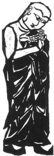
棟方志功《二菩薩釈迦十大弟子より阿難陀の佛》 昭和14年印刷・昭和30年版 横山画