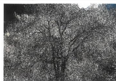
写団ひうち45周年写真展